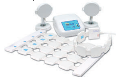
АЛМАГ-02 — верный помощник в лечении коксартроза!

Он разрабатывался для медучреждений. Но благодаря простому и удобному управлению дает возможность успешно справляться с острыми и хроническими недугами в домашних условиях. Хорошая переносимость магнитного поля АЛМАГа-02 у пожилых и ослабленных больных позволяет применять его, когда лечение другими средствами противопоказано.